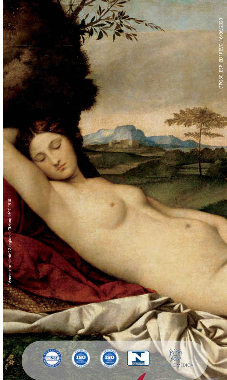
"Venere dormiente", Giorgione e Tiziano 1507-1510

BIOSTIMULACIÓN CELULAR El dispositivo estimula SU metabolismo celular, promoviendo así la regeneración de tejidos, respetando la fisiología de los sustratos biológicos.